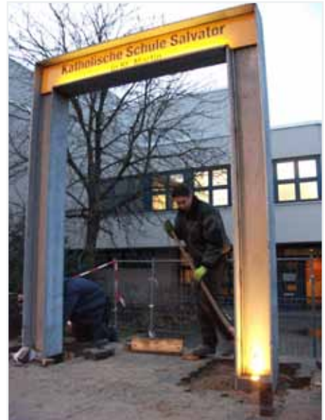
Errichtung des neuen Portals an der Salvator-Grundschule im Märkischen Viertel