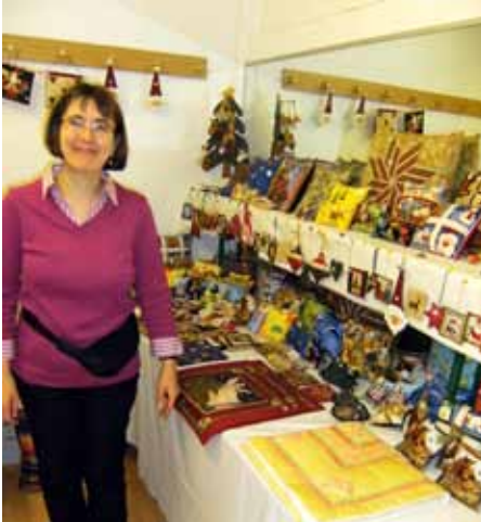
Aufwändige Handarbeiten als Geschenkidee

Ein ganzes Jahr hatten wir auf unseren zweitägigen Basar hingearbeitet und stets gebangt, ob er (wieder) ein Erfolg werden würde. Schließlich gab es einen Ruf zu verlieren!! Also war den gesamten Sommer über das Marmelade- und im Oktober dann das Kürbis-Kochen angesagt. Handarbeiten und Basteleien wurden an zahlreichen Nachmittagen und Fernseh-Abenden gefertigt. Ab Anfang November wurden die Kekse gebacken und von zwei unermüdlichen Damen Adventsgestecke hergestellt. Letztendlich stellte sich nur noch die Frage: Werden wir ausreichend Kuchenpenden erhalten?