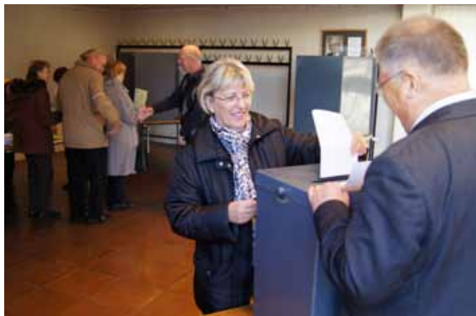
Wählerin bei der Stimmabgabe zur Wahl des PGR