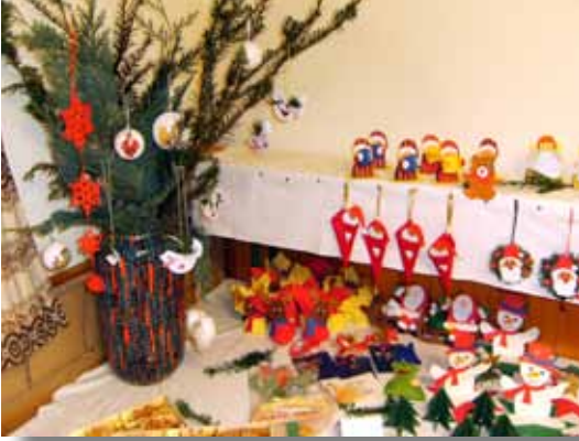
Hübsche Weihnachtsdekoration fürs gemütliche Heim

Als wir am Sonntag um 17:00 Uhr die Türen wieder schlossen, konnten wir zu Recht sagen: Unser Basar war erneut ein voller Erfolg.