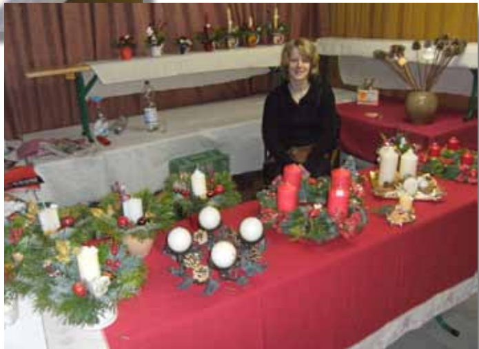
Festliche Adventsgestecke und Adventskränze