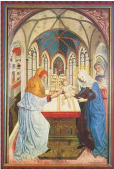
„Darstellung des Herrn“ (Meister der Pollinger Tafeln)

Laut der Werbung in den Medien haben Sie schon lange das Ende der Weihnachtszeit erreicht, wenn Sie diese Ausgabe in den Händen halten. In den letzten Jahren mussten wir lernen, dass Weihnachten schon nach den Sommerferien beginnt, und mit dem Schließen der Geschäfte am Heiligen Abend endet. Nun gut, da gibt es dann noch die Geschenkeübergabe, und die Umtauschmöglichkeiten am 27.12., und natürlich Tausch des Bargeldes in Waren zwischen den Feiertagen. Aber dann ist nun wirklich Schluss. Oder doch nicht?